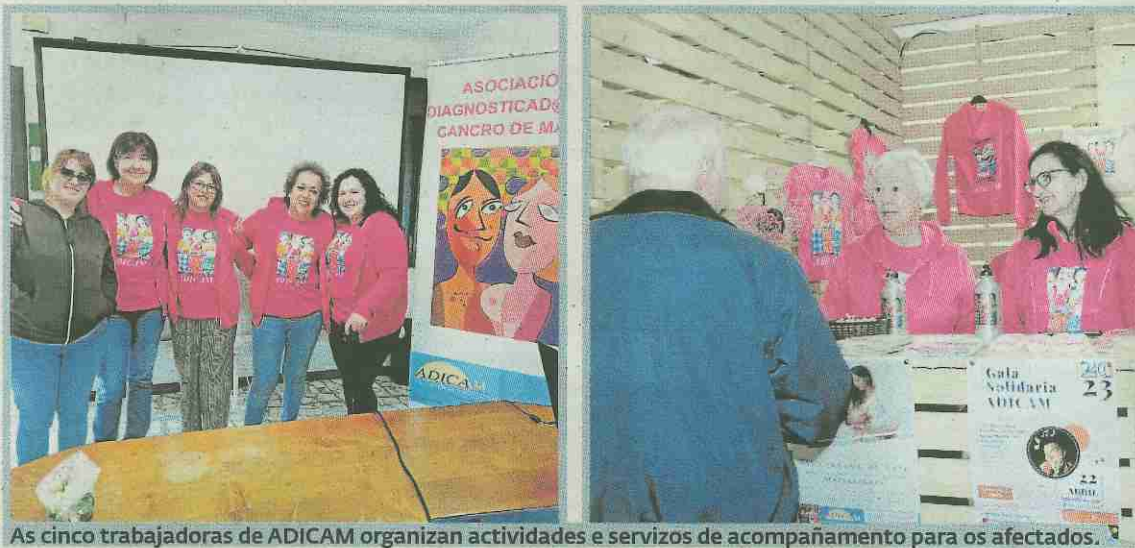
As cinco trabadoras de ADICAM organizan actividades e servizos de acompañamento para os afectados.