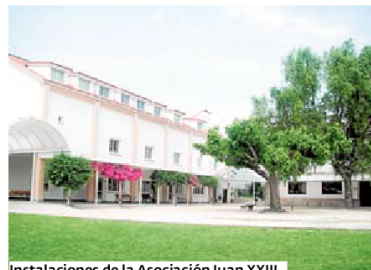
Instalaciones de la Asociación Juan XXIII.

en obtener esta última acreditación a nivel nacional. En el año 2017 se nos concede el sello de ONG Acreditada de la Fundación Lealtad actualmente conocido como "Dona con Confianza" que nos certifica como entidad Transparente y con Buenas Prácticas.