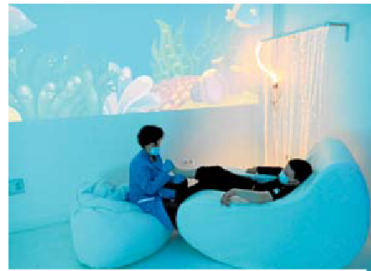
Profesional realizando rehabilitación con un usuario.